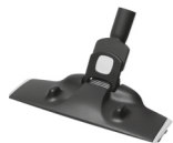
Speedy Clean nozzle Ref: ZE065